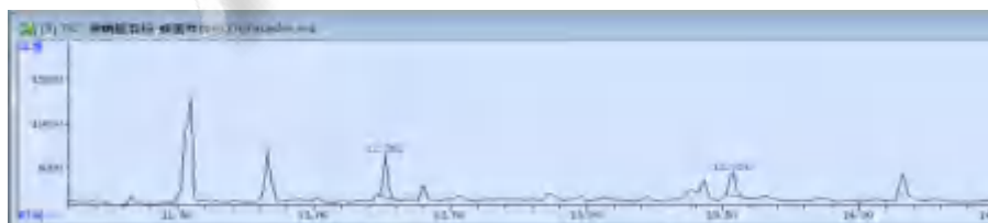
图 3. 蜂蜜样品加标 0.02mg/kg 图谱

声明:除非另有说明,此报告结果仅对该测试样品负责。本报告未经公司许可,不可复制。